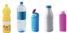
Emballages en plastique